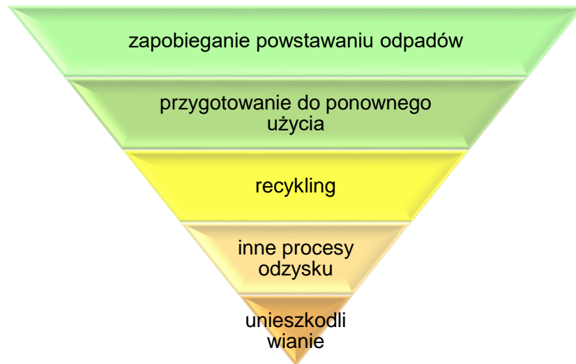
Rysunek 1 Hierarchia postępowania z odpadami

Powyżej [rys. 1] przedstawiono hierarchię postępowania z odpadami wg art. 4 Dyrektywy 2008/98/WE, która dotyczy postępowania i gospodarowania odpadami. Należy dążyć w pierwszej kolejności do zapobiegania powstawaniu odpadów.