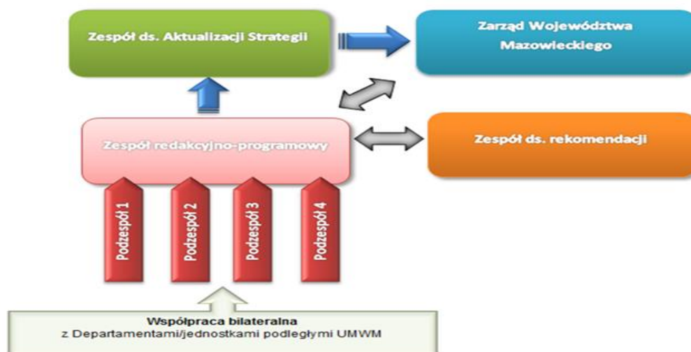
Rysunek 1. Schemat współpracy w ramach zespołów zadaniowych.

Wypracowany w podzespołach kształt Programu każdorazowo przekazywany został do uzgodnienia na ogólnym posiedzeniu Zespołu redakcyjno-programowego. Następnie ostateczne stanowisko przekazywano pod obrady Zespołu ds. Aktualizacji Strategii. Po uzyskaniu pozytywnego stanowiska, dokument był przekazywany na posiedzenie Zarządu Województwa Mazowieckiego.