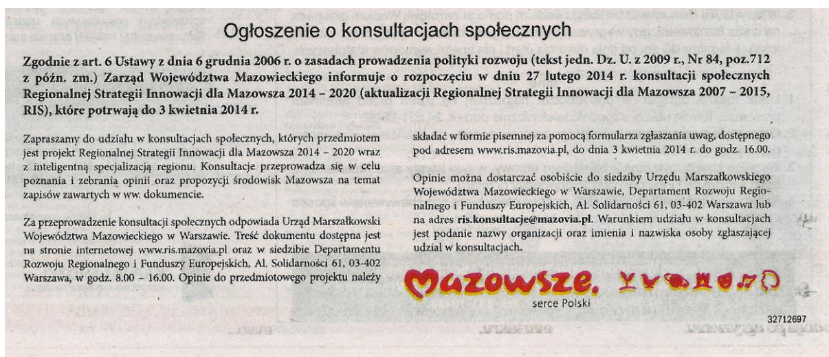
Fot. 1 Ogłoszenie informacji o konsultacjach społecznych projektu Regionalnej Strategii Innowacji dla Mazowsza 2014 – 2020 wraz z inteligentną specjalizacją regionu w wydaniu Gazety Wyborczej

Zgodnie z art. 6 ust. 2a Ustawy o zasadach prowadzenia polityki rozwoju Zarząd Województwa Mazowieckiego skierował do publicznej wiadomości informację o przebiegu konsultacji społecznych projektu RSI 2014-2020 poprzez ogłoszenie w wydaniu Gazety Wyborczej (Gazeta Radom, Gazeta Stołeczna, Gazeta Płock), które ukazało się w dniu 27 lutego 2014 r. (fot.1).