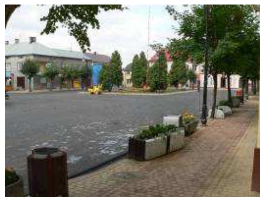
Odnowione centrum Gąbina

Dzięki realizacji tego typu projektów zmieniają się oblicza wsi. Odnowione przestrzenie (rynk, place, parki) stają się wizytówkami wiosek. Wokół nich koncentruje się życie społeczne mieszkańców.