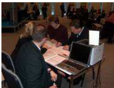
Podpisanie umowy z Samorządem Województwa