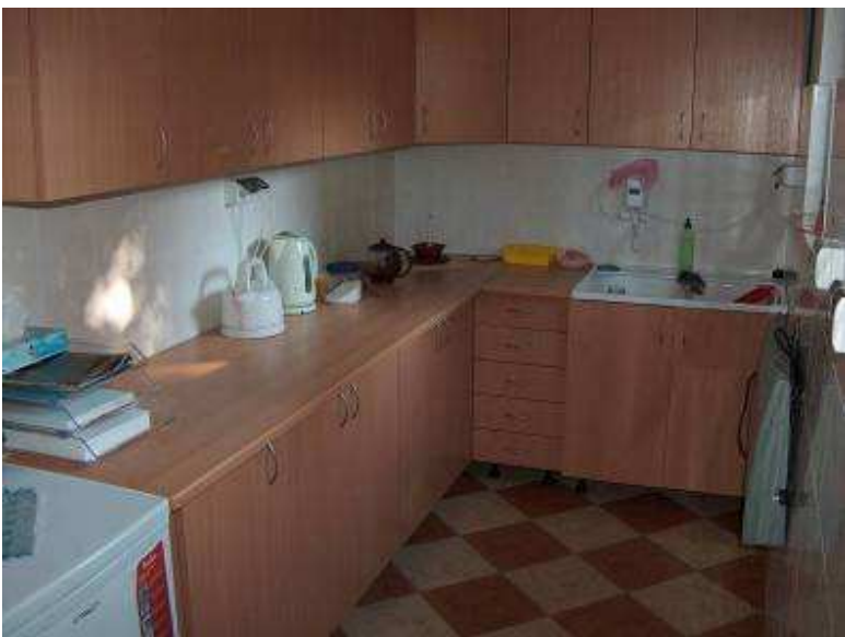
Zaplecze kuchenne świetlicy wiejskiej – gmina Łochów

Jednym z najważniejszych celów odnowy wsi jest integrowanie społeczności lokalnych. Służyć temu mają projekty polegające na budowie i modernizacji świetlic wiejskich, domów kultury i innych miejsc spotkań. W obiektach tych ma koncentrować się społeczno – kulturalne życie mieszkańców. Przy realizacji tych projektów szczególnie istotne jest, aby rzeczywiście powstawały one w wyniku ich oddolnej inicjatywy.