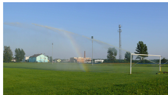
Wielofunkcyjne boisko sportowe w Wieliszewie

Aktualnie realizowane są lub już ukończone projekty polegające na budowie hal sportowych, boisk wielofunkcyjnych, ścieżek zdrowia i placów zabaw.