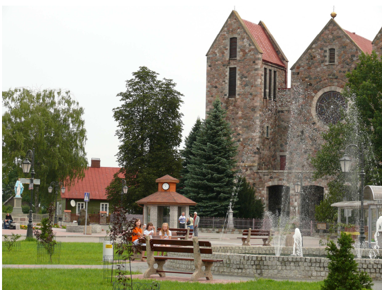
Odnowione centrum Troszyna