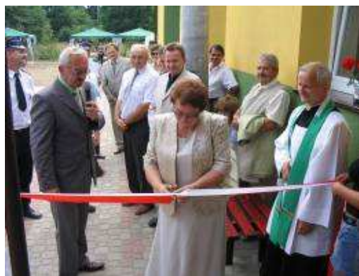
Uroczystość otwarcia nowo odremontowanej świetlicy

Otwarcie odremontowanej świetlicy – stanowiącej w poczuciu mieszkańców ich własność, wielokrotnie staje się okazją do spotkania całej społeczności wsi.