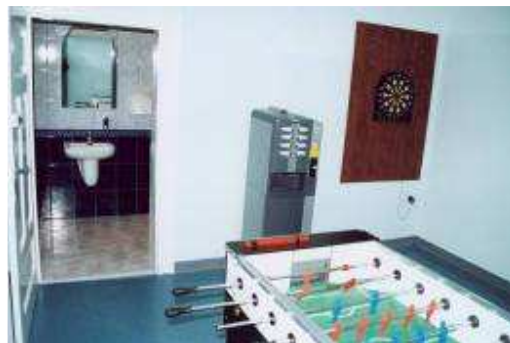
Wyposażenie świetlicy młodzieżowej w sprzęt rekreacyjny

Świetlice wiejskie (również te przy remizach OSP) w wyniku dofinansowania z „Odnowy wsi” zyskały wyremontowane sale spotkań, wyposażone zostały w nowoczesne zaplecza kuchenne, sprzęt multimedialny, komputerowy oraz rekreacyjny dla młodzieży.