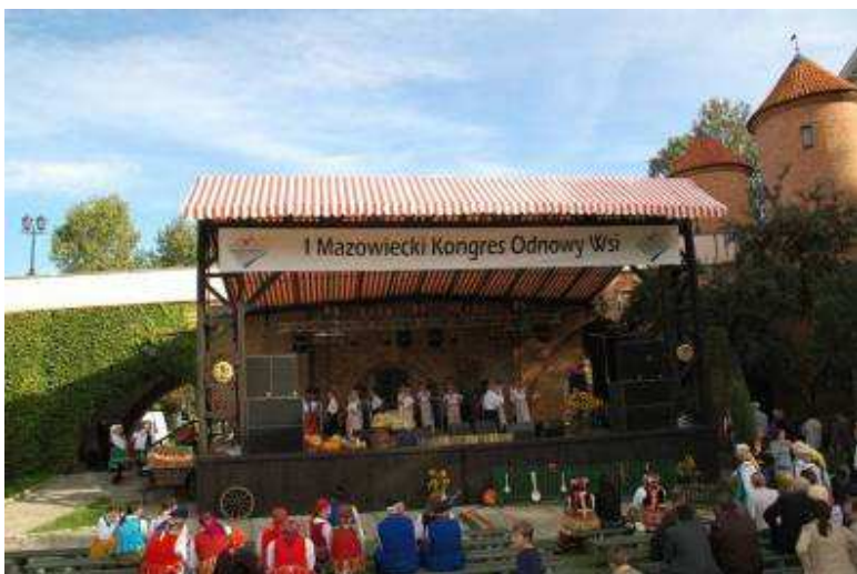
Impreza plenerowa – 2 dzień Kongresu Odnowy Wsi Mazowieckiej w Pultusku