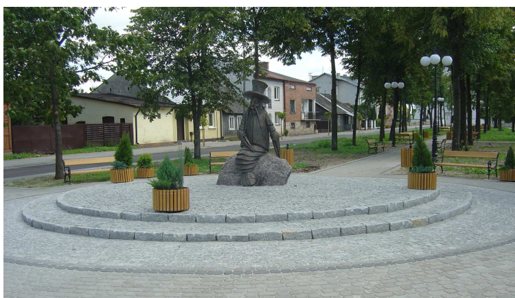
Projekt zrealizowany w Jedlińsku – jego elementem był i pomnik raka co podkreślało związek z tradycją miejscowości i gminy.