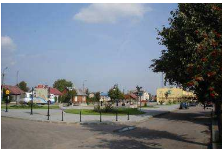
Zagospodarowanie centrum Nura