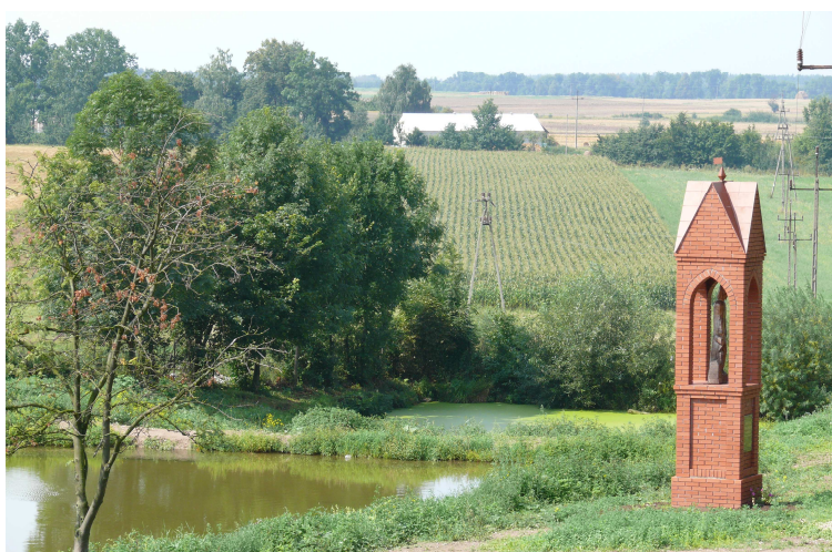
Renowacja kapliczki wiejskiej