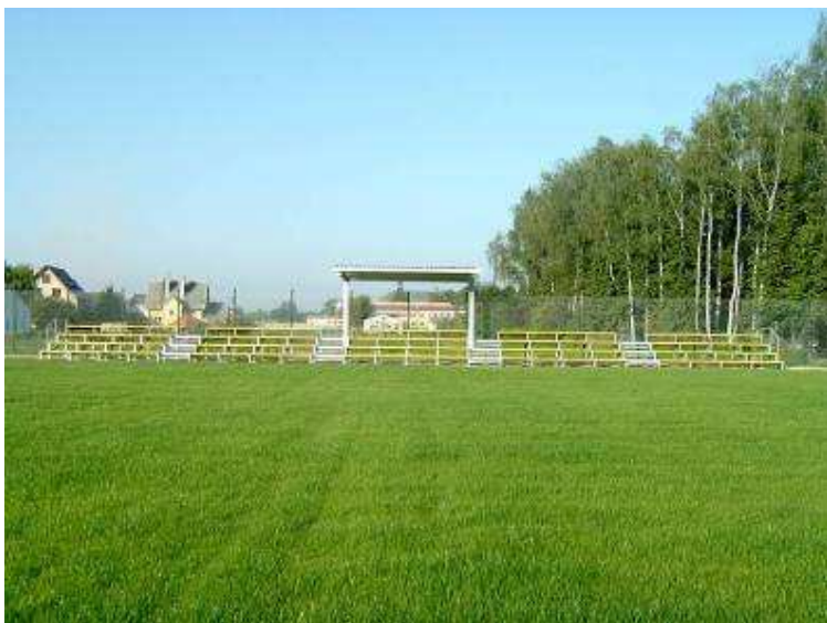
Pełnowymiarowe boisko piłkarskie z trybunami w Skórcu