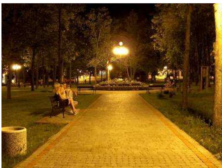
Odnowiony park w Ciepiewie