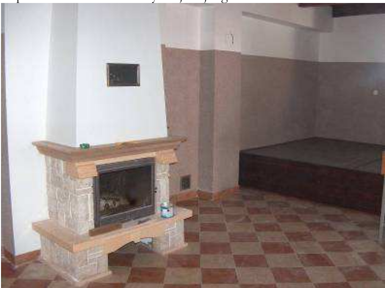
Sala spotkań mieszkańców w świetlicy.