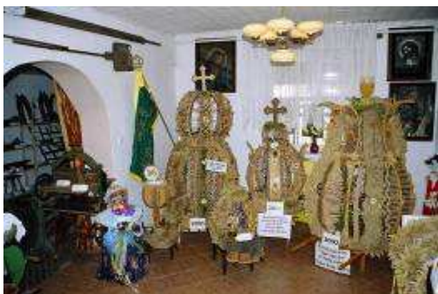
Wiejska Izba Pamięci w Domu Ludowym