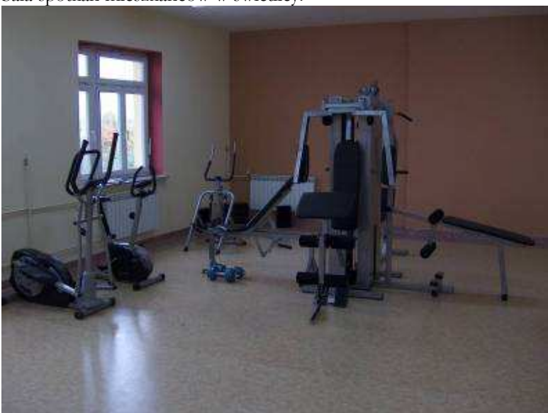
Wyposażenie świetlicy wiejskiej w Wielgim w zaplecze sportowe (gm. Ciepelów)