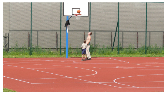
Zespół boisk wielofunkcyjnych w Gminie Myszyniec

W ramach ww. projektów znajdują się zarówno małe obiekty, powstające jako uzupełnienie kompleksowej inwestycji (małe boisko czy element placu zabaw przy świetlicy wiejskiej) jak i duże takie jak pełnowymiarowe boiska piłkarskie z trybunami oraz nowoczesne hale sportowo – widowiskowe.