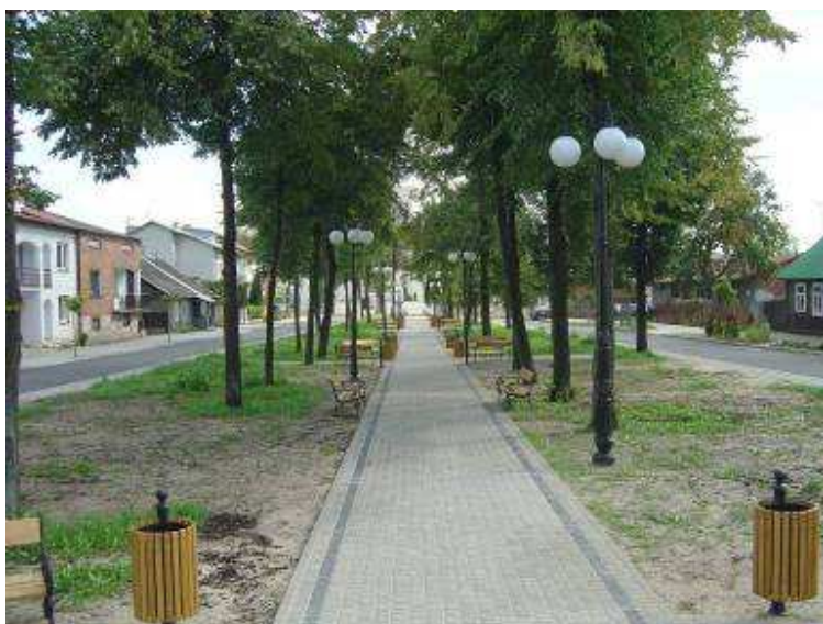
Zieleń w centrum Jedlińska