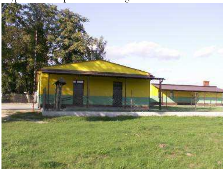
Odnowiony budynek świetlicy wiejskiej

Zdjęcia świetlic wiejskich pochodzą z projektów realizowanych w gminach: Stoczek, Ciepiałów i Łochów