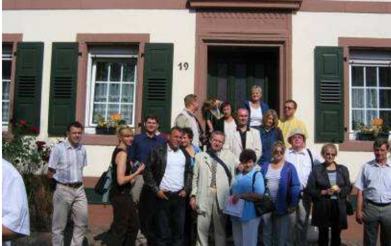
Wizyta studyjna w Nadrenii – Palatynacie (Niemcy) – wrzesień 2004 r.

Występ gwiazdy wieczoru - zespołu „Universe” na zakończenie I Kongresu