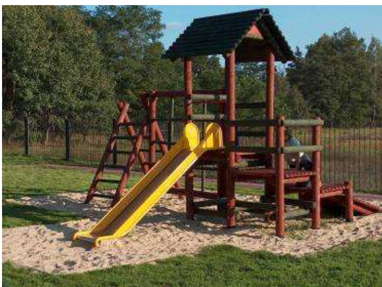
Element placu zabaw przy świetlicy wiejskiej – Gmina Łochów