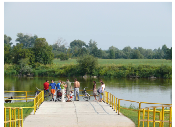
Brańszczyk – przystań na Bugu

Przykładem bardzo dobrze zrealizowanych inwestycji z tego zakresu są projekty w Gminie Serock (ścieżka edukacyjno – krajoznawcza Wierzbica – Jadwisin, stanowiąca element zagospodarowania brzegów Zalewu Zegrzyńskiego) oraz w Gminie Brańszczyk (przystań na Bugu – zdjęcie poniżej)