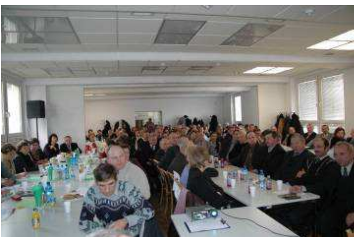
Cykl spotkań z sołtysami – w 6 spotkaniach wzięło udział ponad 500 liderów wsi.