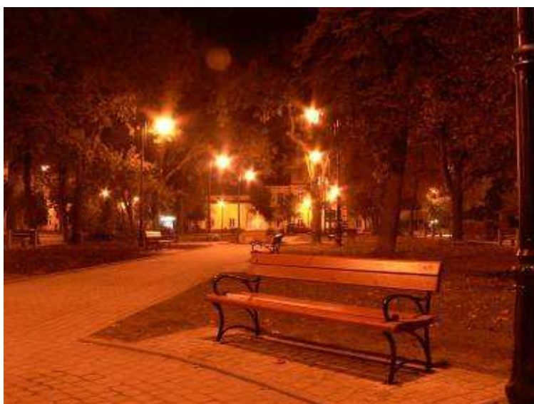
Park w centrum Gąbina