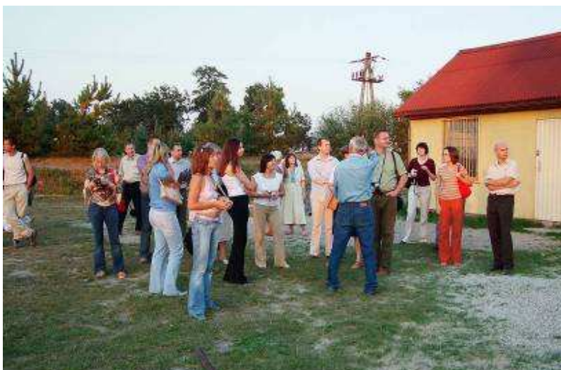
Wizyta studyjna na Opolszczyźnie – wrzesień 2005 r.