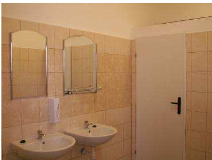
Wyposażenie zaplecza sanitarnego

Otwarcie odremontowanej świetlicy – stanowiącej w poczuciu mieszkańców ich własność, wielokrotnie staje się okazją do spotkania całej społeczności wsi.