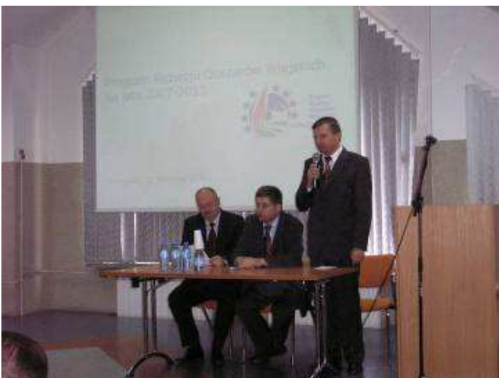
W spotkaniach z sołtysami uczestniczyli: Marszałek Województwa, Członkowie Zarządu, dyrektorzy Departamentu Rolnictwa i Modernizacji Terenów Wiejskich.