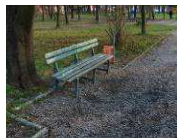
Stare ławki w Parku