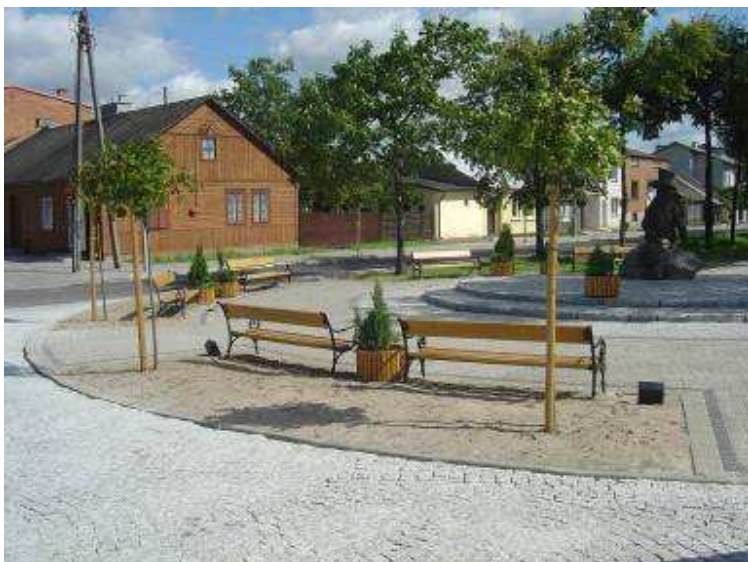
Renowacja głównego placu w Jedlińsku