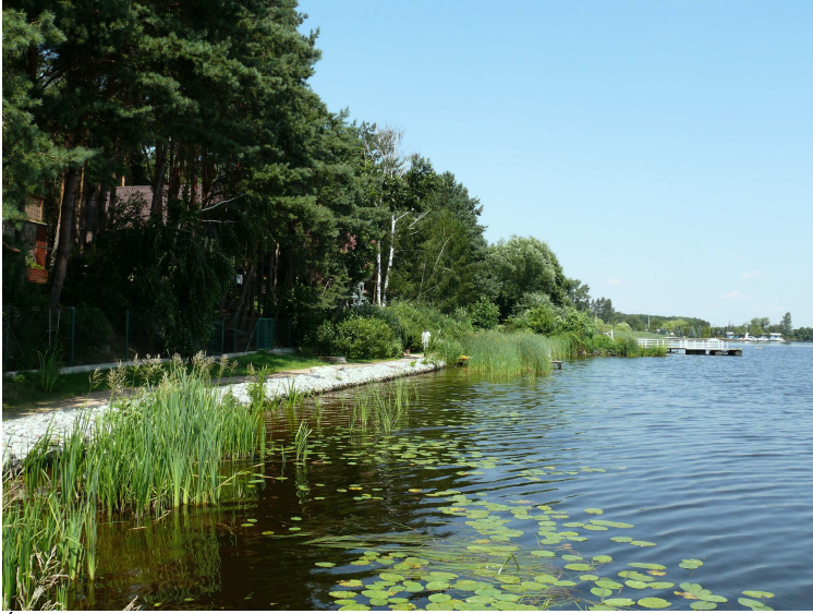
Ścieżka edukacyjno – krajoznawcza wzdłuż brzegów Zalewu Zegrzyńskiego (Gmina Serock)