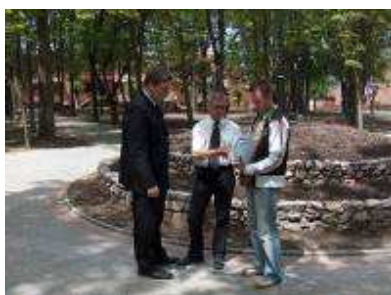
Konsultacje z wykonawcami projektu