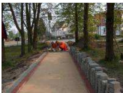
Prace budowlane w parku