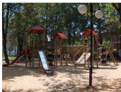
Instalacja elementów rekreacyjnych dla dzieci