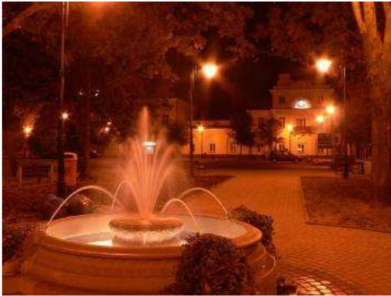
Fontanna na rynku w Gąbinie