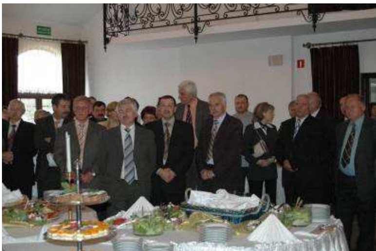
Uczestnicy I Kongresu Odnowy Wsi Mazowieckiej