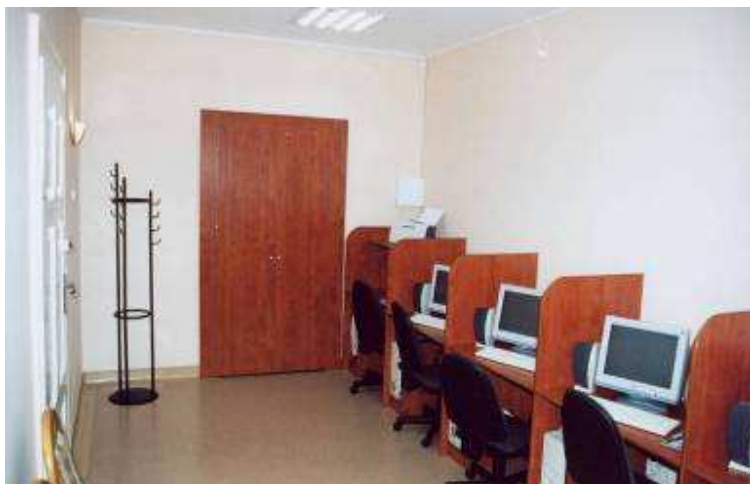
Kafejka internetowa w świetlicy wiejskiej

Świetlice wiejskie (również te przy remizach OSP) w wyniku dofinansowania z „Odnowy wsi” zyskały wyremontowane sale spotkań, wyposażone zostały w nowoczesne zaplecza kuchenne, sprzęt multimedialny, komputerowy oraz rekreacyjny dla młodzieży.