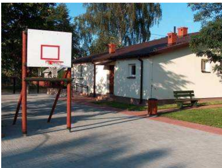
Mini boisko do koszykówki przy świetlicy wiejskiej – Gmina Łochów