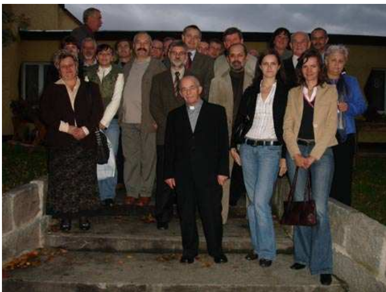
Uczestnicy IV wizyty studyjnej w Woj. Opolskim – wrzesień 2007 r.