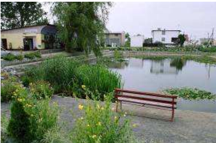
Zagospodarowanie zbiorników przeciwpożarowych na cele rekreacyjne

Osobną grupą projektów są inwestycje polegające na zagospodarowaniu zbiorników i cieków wodnych na potrzeby turystyki i rekreacji. Często występujące na wsiach strumyki i zbiorniki np. przeciwpożarowe które utraciły już swoją rolę mogą stać się wizytówką miejscowości jeżeli stworzy się wokół nich odpowiednią infrastrukturę. Program „Odnowa wsi...” umożliwia m.in. oczyszczenie takiego zbiornika, zagospodarowanie terenu wokół oraz budowę urządzeń rekreacyjnych.