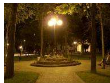
Nowe oświetlenie parkowe