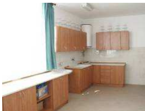
Zaplecze kuchenne świetlicy wiejskiej – gmina Stoczek

Utożsamienie się mieszkańców z realizowanym na ich terenie obiektem będzie rzutowało na to czy będzie on tętnił życiem lokalnej społeczności. Dlatego też, Urząd Marszałkowski Województwa Mazowieckiego, zgodnie z ideą „Odnowy wsi...” w naborze wniosków do w 2005 roku wprowadził kryterium regionalne, które miało pobudzać inicjatywę mieszkańców – dodatkowy punkt przyznawany był za pracę społeczną przy realizacji inwestycji.