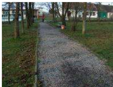
Stan alejek parkowych przed robotami