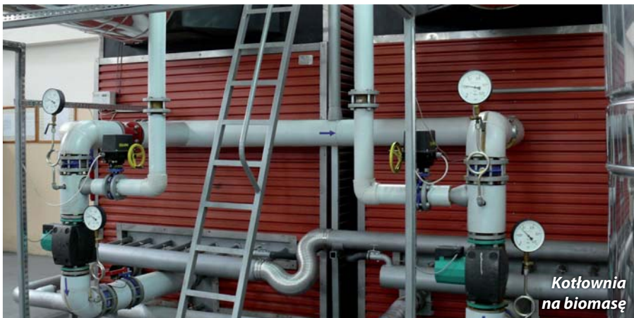
Kotłownia na biomasę