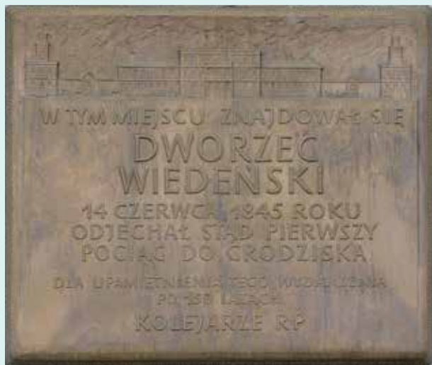
Tablica upamiętniająca Dworzec Wiedeński na Dworcu Warszawa Śródmieście

ZADANIE: Narysujcie plakat – Józef Piłsudski jako ojciec niepodległości – hasło możecie wymyślić sami. (Ekspert przyznaje za plakat od 1 do 8 p.)