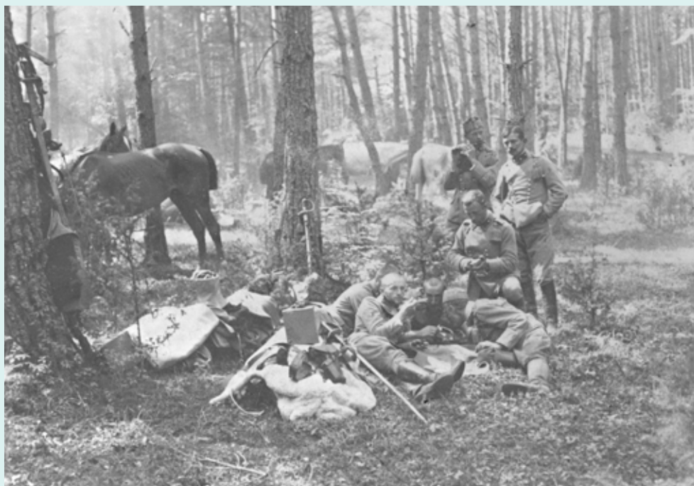
Patrol 1 Pułku Ułanów I Brygady Legionów na odpoczynku w lesie

Warszawy, ważne bilety autobusowe, długopisy, kolorowe mazaki, telefony komórkowe, smartfony lub tablety. Na każdym przystanku eksperci mają do dyspozycji teksty źródłowe, pytania i zadania, schemat przykładowej odpowiedzi, zalecane punktowanie oraz ciekawostki, które można przekazać grupom podczas gry terenowej. Po każdym zdobytym przez grupę przystanku ekspert wypełnia kartę punktacji. Zaleca się połączenie kilku szkół do przeprowadzenia gry terenowej w Warszawie. Nagrody w grze terenowej zależą od organizatora i fundatorów. Niektóre elementy gry terenowej można wykorzystać na lekcji historii lub języka polskiego.