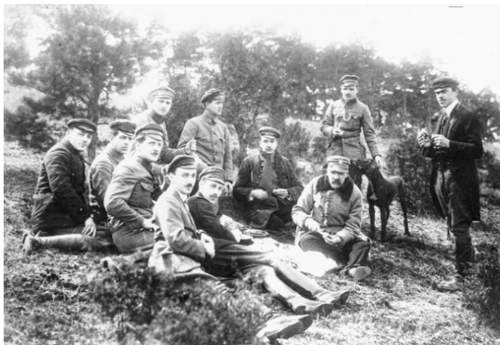
Ćwiczenia polowe batalionu Polskiej Organizacji Wojskowej, 29.04.1917

Wisława Szymborska, Gawęda o miłości ziemi ojczystej