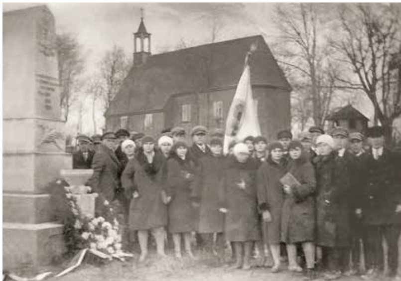
Pomnikiem na placu Wolności oficjalnie opiekowało się Koło Młodzieży z Rębowa. Zdjęcie wykonano na placu Wolności w latach trzydziestych XX w.