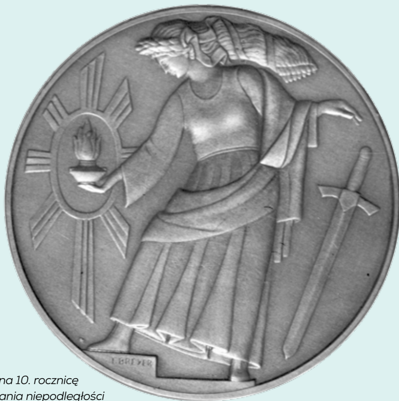
Medal na 10. rocznicę odzyskania niepodległości

Podsumowanie zajęć za pomocą kilku pytań ( załącznik nr 4 ).