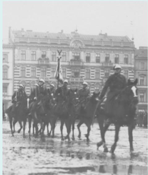
Obchody Święta Niepodległości na placu Saskim w Warszawie, 1926

Uczniowie w grupach wspólnie z nauczycielem dzielą się zadaniami. Do każdego miejsca pamięci przypisana jest inna grupa. Grupy poznają historię związaną z wybranym miejscem. Między lekcjami zbierają materiały i przedstawiają je wspólnie podczas lekcji. Nad merytorycznym przebiegiem prac czuwa nauczyciel. Grupa zajmująca się wizualizacją mapy konsultuje się z nauczycielem geografii i tworzy projekt mapy i legendy. Grupa ta ma także zaplanować, gdzie zostaną umieszczone informacje i zdjęcia o obiektach związanych z historią regionu. Zespół zajmujący się pisaniem sprawozdań i dokumentowaniem wszystkich działań wszystkich grup projektowych (zdjęcia i filmy) pracuje na każdej lekcji. Grupa tworząca stronę internetową konsultuje się z nauczycielem informatyki.