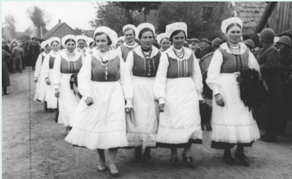
Uroczystość odsłonięcia pomnika z okazji 20. rocznicy odzyskania niepodległości w Woli Wiązowej, 1938

Grupa zajmująca się dokumentowaniem działań wykonuje ostatnie zdjęcia i pisze sprawozdanie podsumowujące, które zostaje opublikowane na stronie internetowej szkoły oraz szkolnym profilu na Facebooku i wysyłane do mediów.