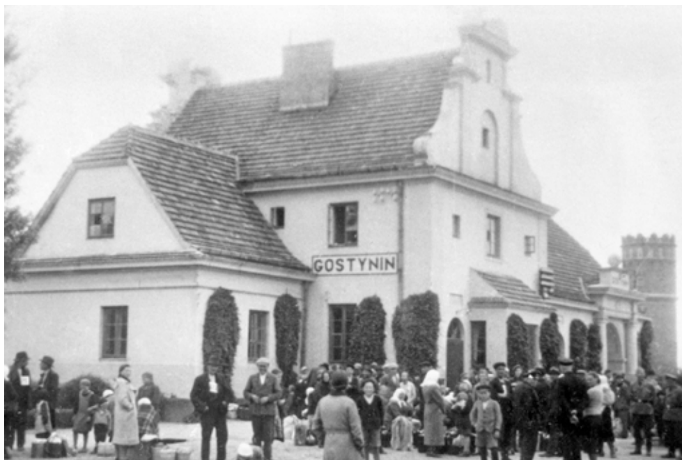
Dworzec kolejowy w Gostyninie w czasie okupacji