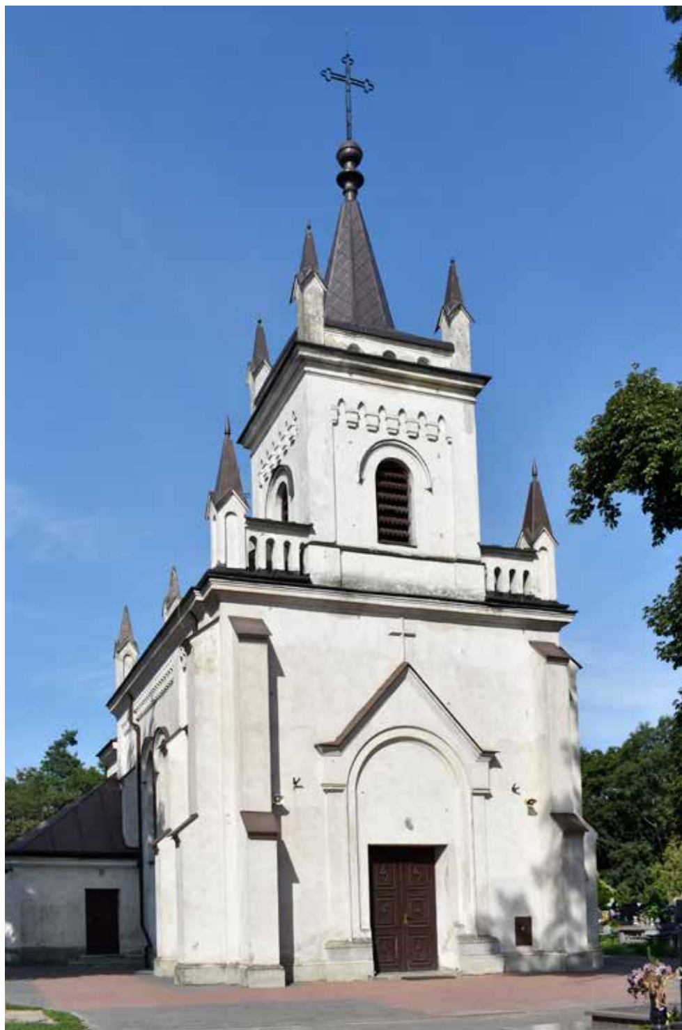
Kaplica św. Jakuba w Gostyninie