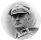
Władysław Sikorski 1881–1943