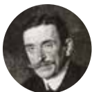
Zdzisław Lubomirski 1865–1943