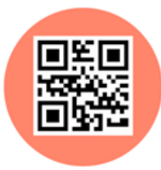
QR KOD 2