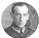
Józef Beck 1894–1944

Przyjrzyj się galerii zdjęć osób zaangażowanych w działania niepodległościowe. Następnie przeczytaj notkę biograficzną jednej z postaci. W tekście znajdziesz cztery nazwiska malarzy, których twórczość wspierała ruch niepodległościowy.