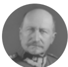
Józef Dowbor-Muśnicki 1867–1937