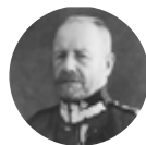
Lucjan Żeligowski 1864–1947