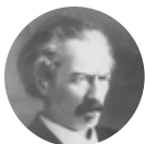
Ignacy Paderewski 1860–1941