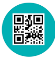
QR KOD 3