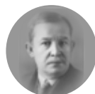
Wojciech Korfanty 1873–1939