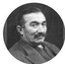
Wincenty Witos 1874–1945