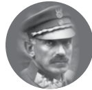
Stanisław Szepczycki 1867–1950