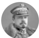
Józef Haller 1873–1960