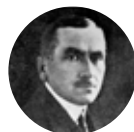
Roman Dmowski 1864–1939