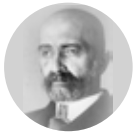
Walery Sławek 1879–1939