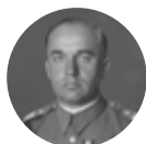
Tadeusz Kasprzycki 1891–1978