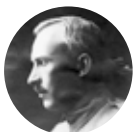
Walerian Czum 1890–1962