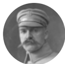
Józef Piłsudski 1867–1935