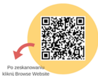
QR KOD 1

30 – liczba głosek w odpowiedzi na pytanie 1 + 2 × liczba powtórzeń samogłoski „o” z odpowiedzi na pytanie 2 × odpowiedź na pytanie 3 = ?