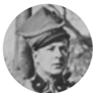
Bolesław Wieniawa-Đługosowski 1881–1942