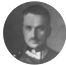
Kazimierz Sosnkowski 1885–1969