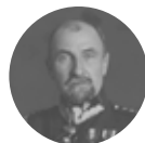
Tadeusz Rozwadowski 1866–1928