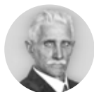
Ignacy Daszyński 1866–1936