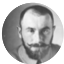
Edward Śmigły-Rydz 1886–1941