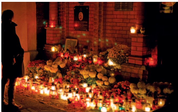
Mogiła harcerza Antolka Gradowskiego, fot. Piotr Roślaniec.