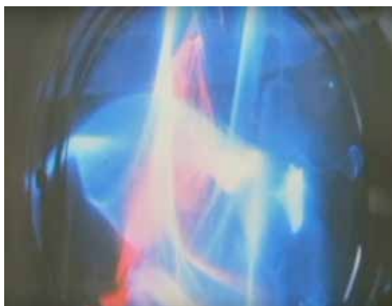
Stanisław Ostoja-Kotkowski, obraz utworzony światłem i dźwiękiem, 1972 r.