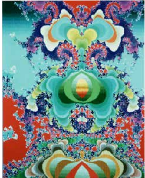
Stanisław Ostoj-Kotkowski, Fraktale, lata 80.