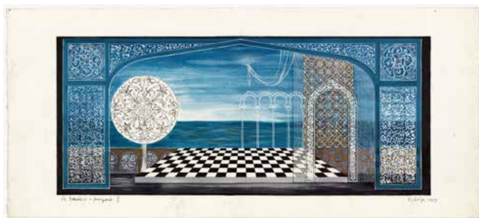
Stanisław Ostoja-Kotkowski, Uprowadzenie z seraju Mozarta , 1963 r.