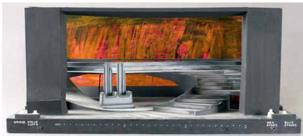
Stanisław Ostoja-Kotkowski, Projekt dekoracji teatralnej