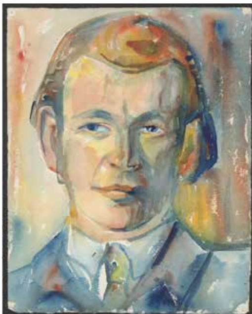
Stanisław Ostoja-Kotkowski, Autoportret