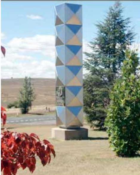
Pomnik Tadeusza Kościuszki W Australii, w Cooma, autorstwa Stanisława Ostoi-Kotkowskiego

http://www.zrobotosam.com/PulsPol/Pulis3/index.php?sekcja=4&arty_id=5325