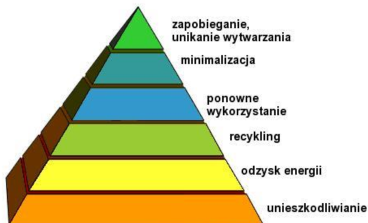
Rysunek 1 Hierarchia postępowania z odpadami 5

Poniżej przedstawiono hierarchie postępowania z odpadami wg art. 4 dyrektywy 4 , która dotyczy zapobiegania powstawaniu odpadów jak i ich gospodarowania.